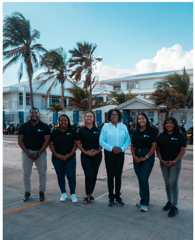
¡Equipo de extensión!