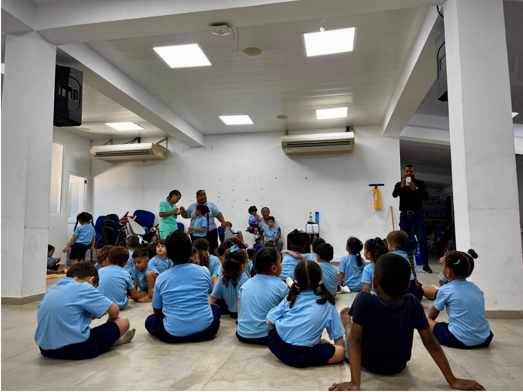
Encuentro deportivo INFOTEP - SENA